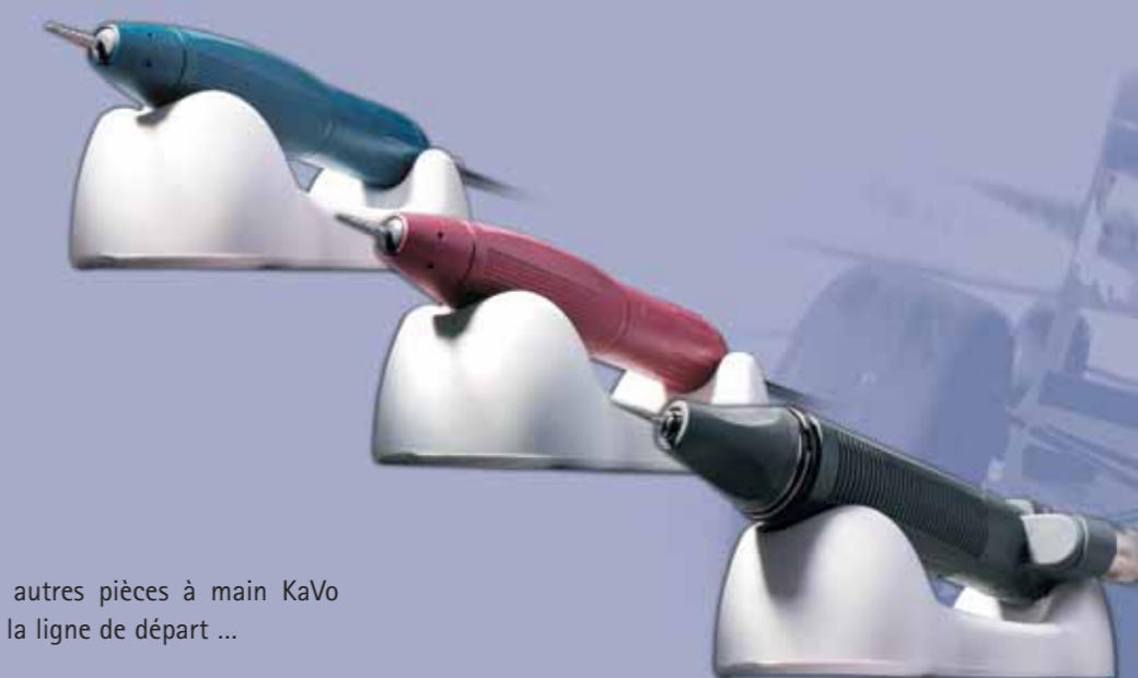
Les autres pièces à main KaVo sur la ligne de départ ...