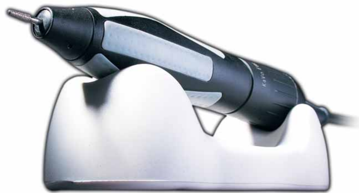
K-Powergrip et son support ergonomique.